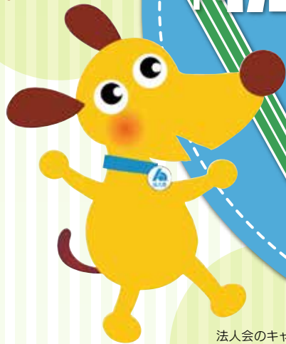
法人会のキャラクター 「けんた」